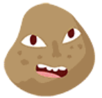
Pomme de terre